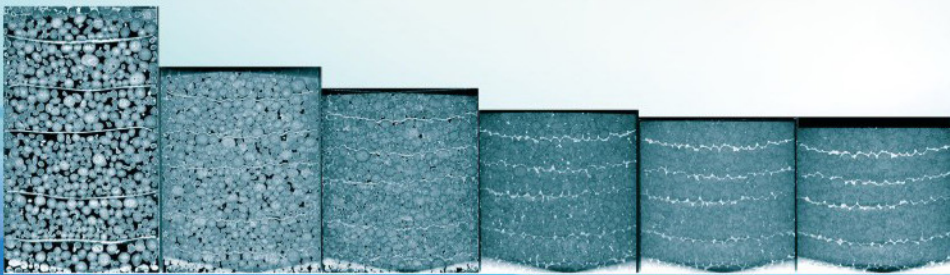
CT images of explosive granules under different forming pressures (the medial axis slices)