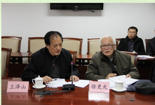
2012年4月，徐院士和王泽山院士参加中国工程院军民融合战略咨询课题研讨会