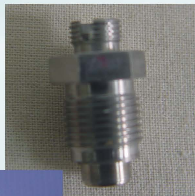
激光爆管、激光雷管

目前，火工品研究室已经建立了激光点火实验系统，激光直接起爆系统和激光驱动飞片起爆实验系统，开发出了激光点火器、激光爆管和激光雷管、具有安全点火装置的小型化激光点火起爆系统及激光多点点火系统等，为激光火工品的推广应用奠定了基础。