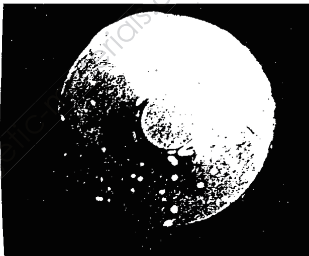
图 2 加压至 4.90MPa 下拉分离器钩时 TATB 被挤出的照片